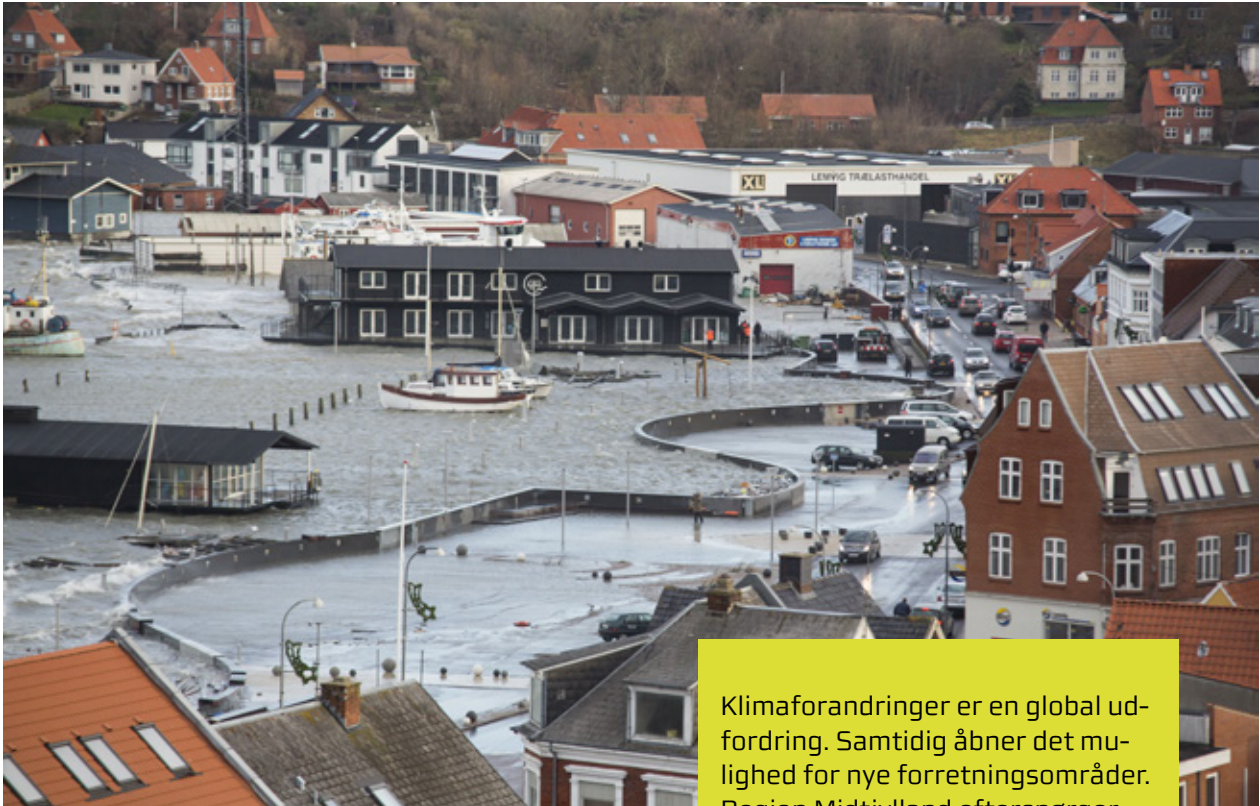
"Le Mur" – Muren i Lemvig