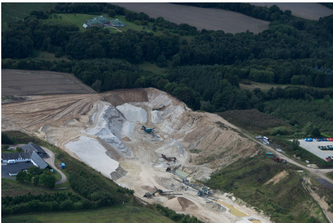
Råstofgrav i råstofgraveområde Tandskov i Silkeborg kommune (foto fra august 2014).

Har du forslag til andre nye fremtidige råstofgraveområder?