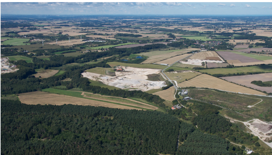
Råstofgrave i råstofgraveområde Glatved i Norddjurs kommune (foto fra august 2014).

På regionens hjemmeside på internetadressen: www.raastofplan-midt.dk ses både gældende råstofgraveområder og råstofinteresseområder.