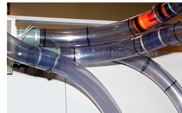
Container i rørene på vej til modtageren

Billederne er illustrative og fra forskellige leverandører. De er udvalgt for at vise hvordan stationer og containerne kan se ud.