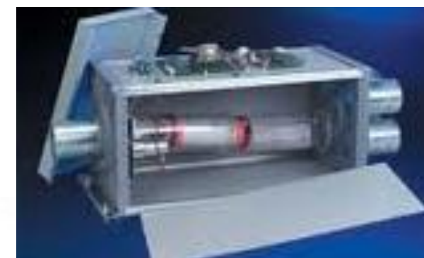
Veksler mellem to rørbaner