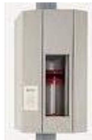
Eksempel på rørpoststation