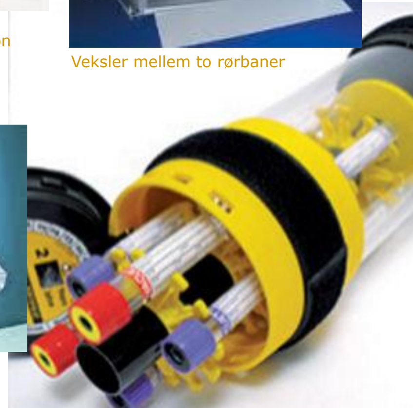
Container: indsatsene er forskellige alt efter det aktuelle gods, der skal sendes.