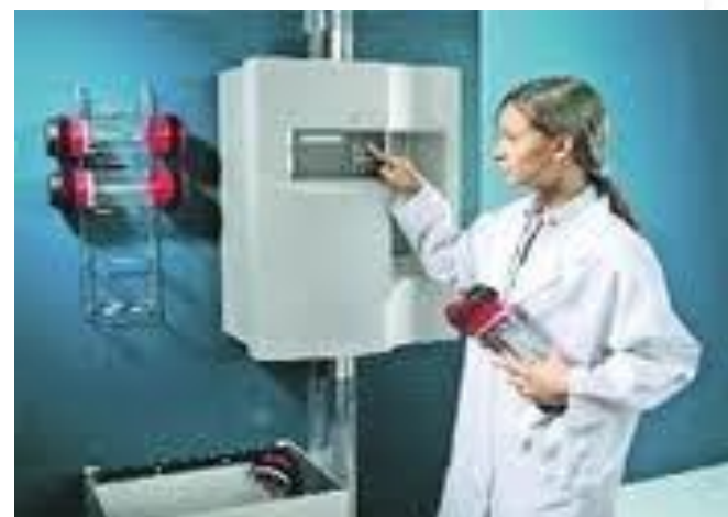
Eksempel på rørpoststation