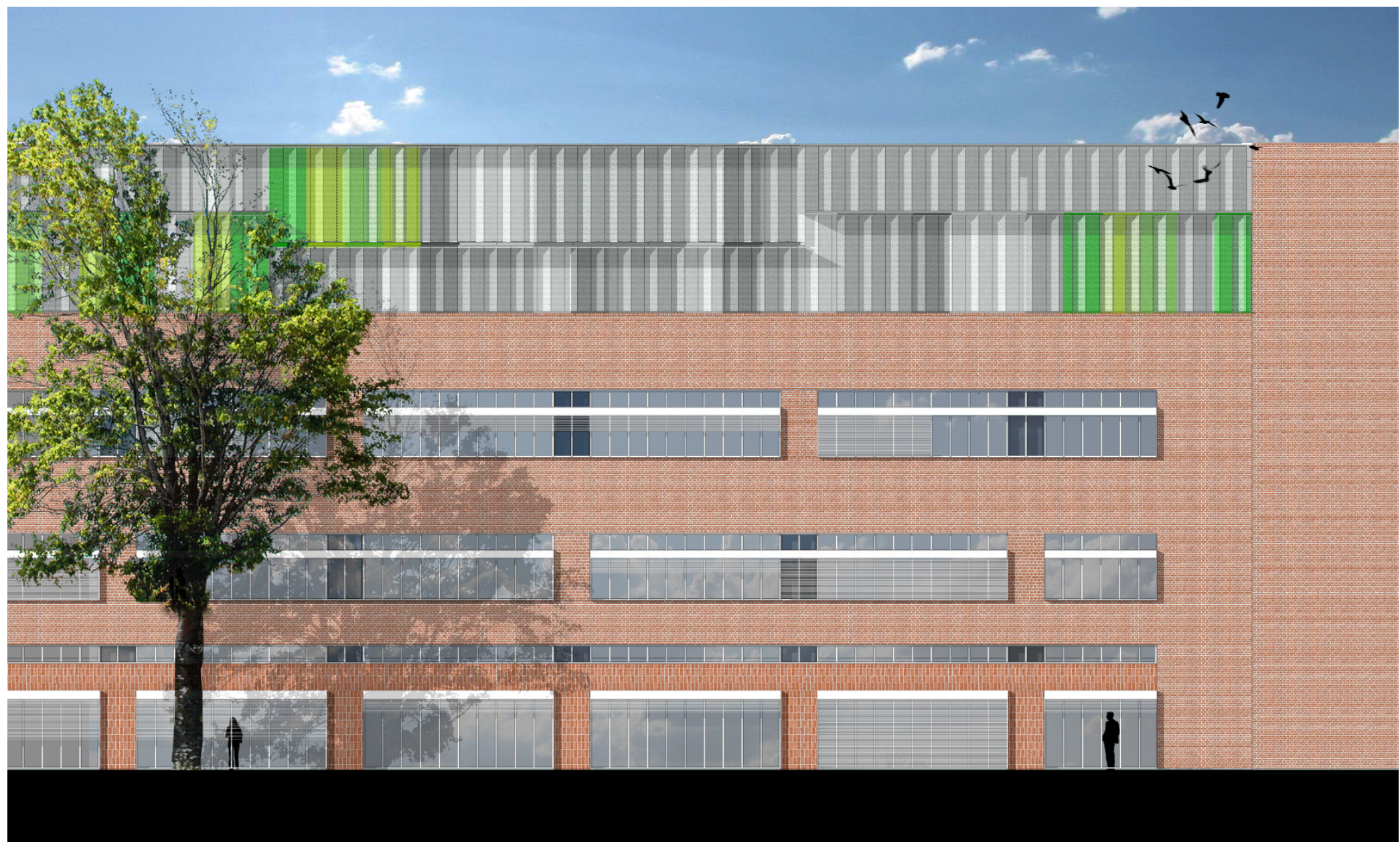
Behandlingsbygning Opstalt mod gårdhave