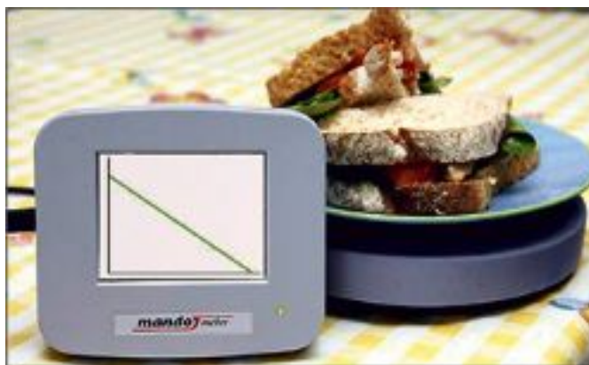
Billedtekst: Mandometer tallerken

Når behandlingen afsluttes, bliver patienten fulgt i 5 år. Der er i alt 11 opfølgninger på de 5 år, hvor besøgene er mest intensive i starten og gradvist udfases.