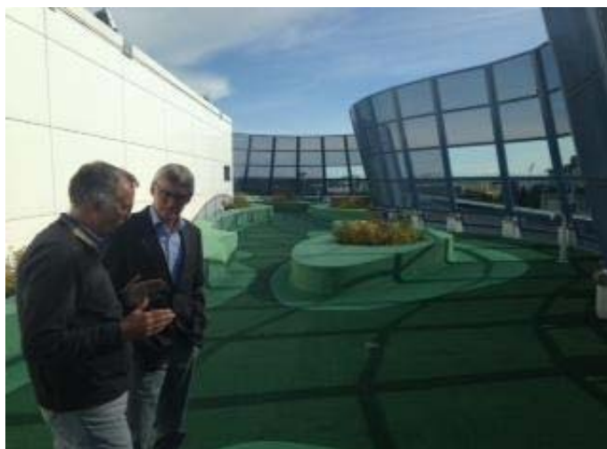
Billedtekst: Udearealet på taget af Psykiatriens Hus

For det andet er Psykiatriens Hus i Uppsala karakteriseret ved at være bygget i højden, og som konsekvens ligger de lukkede afsnits udendørsfaciliteter på taget af bygningen. Det begrænser patienternes frie adgang til udendørsarealer betydeligt, da patienterne skal følges med en medarbejder til haven, og derved adskiller byggeriet sig markant fra den måde, man i de danske psykiatribyggerier meget bevidst