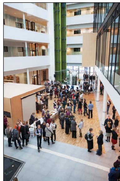
Billedtekst: Det store fælles atrium

Psykiatriens Hus rummer ikke retspsykiatri, da bygningen ikke er sikret til denne målgruppe. Tilgangen i Uppsala til retspsykiatrien er, at den ikke skal placeres sammen med den almene psykiatri. I forhold til børn og ungepsykiatrien har man bevidst valgt at