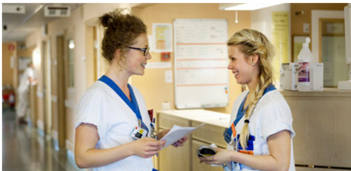
Billedtekst: Personalet bærer uniform

Besøget i Psykiatriens Hus og rundvisningen i huset viste også et anden interessant forhold for Psykiatriens Hus, nemlig at hele personalet – også læger og administrativt personale – bærer uniformer. Uniformerne er udformet forskelligt, så man nemt kan skelne de forskellige personalegrupper fra hinanden.