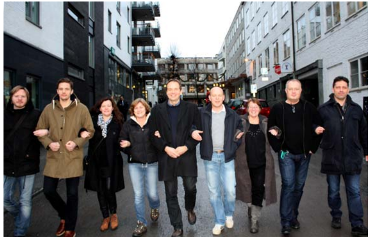
Billedtekst: Medlemmerne af Samhandlingsteamet

Mennesker med denne type problematikker har brug for hjælp fra både kommunale tilbud og fra den specialiserede psykiatri. De mangeartede problemer, som denne patientgruppe har, kræver derfor sammenhængende og fleksible systemer, som kan tilbyde patienterne en tryk og stabil forankring med et langsigtet perspektiv. Dette kan være vanskelig i dagens fragmenterede systemer. Mange patienter og pårørende oplever, at de ikke "passer" ind nogen steder, og at ansvar flyttes frem og tilbage. Dette kan medvirke til, at mulighederne for et bedre liv og bedring for disse borgere går tabt.