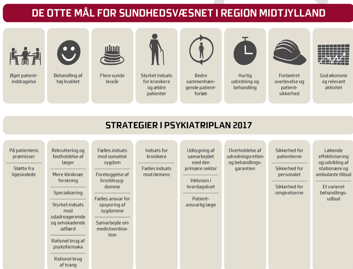
Figur 2: Sammenhæng mellem mål og strategier i Psykiatriplan 2017

Strategierne skal bidrage til, at psykiatrien i Region Midtjylland kan efterleve visionen om at skabe "Bedre behandling og længere liv til flere med psykisk sygdom – på patientens præmisser". Sammenhængen mellem de otte mål for sundhedsvæsnets og strategierne er illustreret i figur 2.