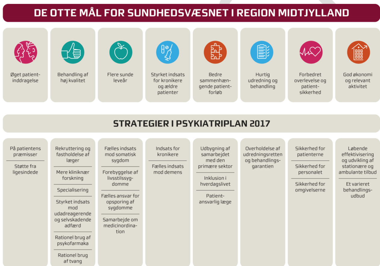
Figur 2: Sammenhæng mellem mål og strategier i Psykiatriplan 2017

Strategierne skal bidrage til, at psykiatrien i Region Midtjylland kan efterleve visionen om at skabe "Bedre behandling og længere liv til flere med psykisk sygdom – på patientens præmisser". Sammenhængen mellem de otte mål for sundhedsvæsnets og strategierne er illustreret i figur 2.