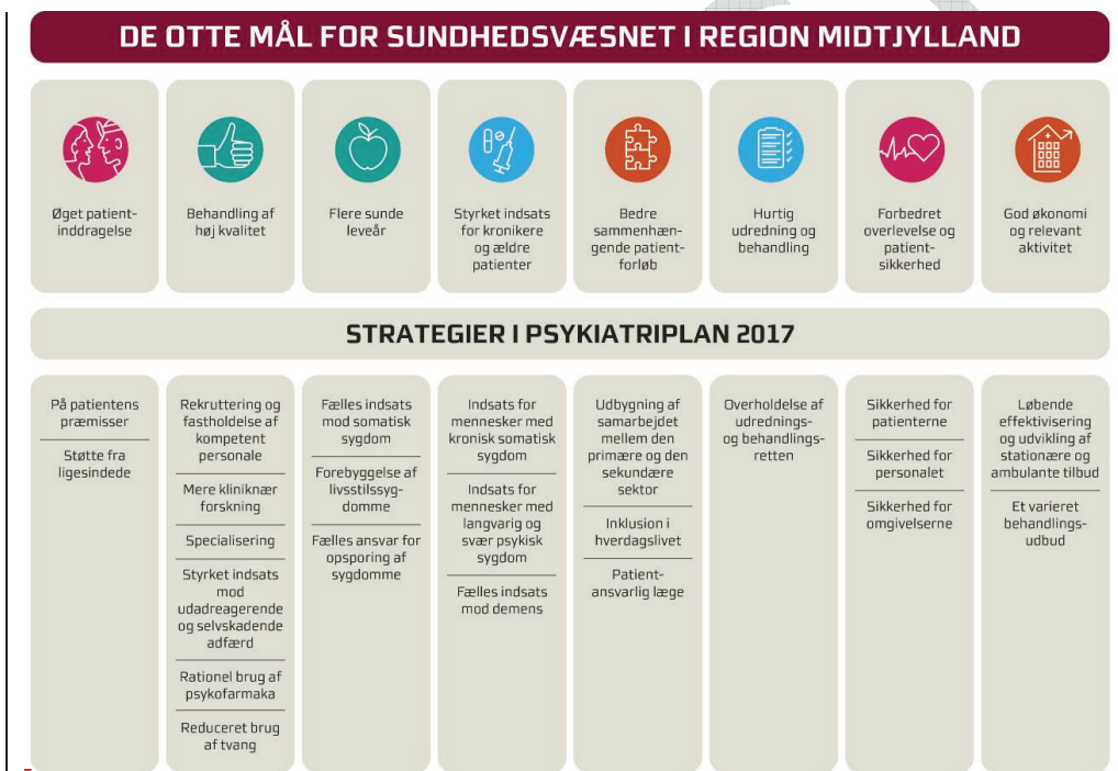
Figur 2: Sammenhæng mellem mål og strategier i Psykiatriplan 2017

Strategierne skal bidrage til, at psykiatrien i Region Midtjylland kan efterleve visionen om at skabe ”Bedre behandling og længere liv til flere med psykisk sygdom – på patientens præmisser” . Sammenhængen mellem de otte mål for sundhedsvæsnets og strategierne er illustreret i figur 2.