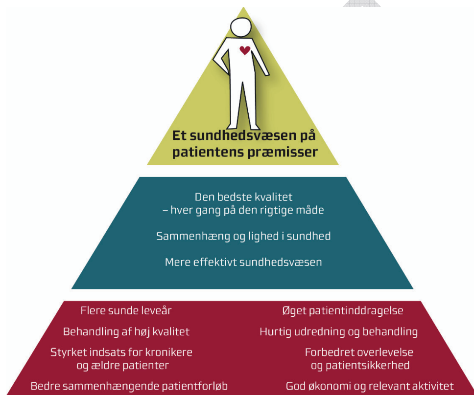
Figur 1: Region Midtjyllands målbillede

Den nederste del af trekanten omfatter de otte mål, som hele sundhedsvæsenet i Region Midtjylland skal styre efter. De otte mål er formuleret med udgangspunkt i de otte fælles nationale mål, der skal sikre, at hospitaler, kommuner og almen praksis arbejder i en fælles retning. Målene omfatter bl.a. flere sunde leveår, behandling af høj kvalitet og hurtig udredning og behandling, som spiller direkte sammen med visionen i Psykiatriplan 2017. De øvrige mål er ligeledes relevante for det psykiatriske område og indgår derfor også i psykiatriplanen.