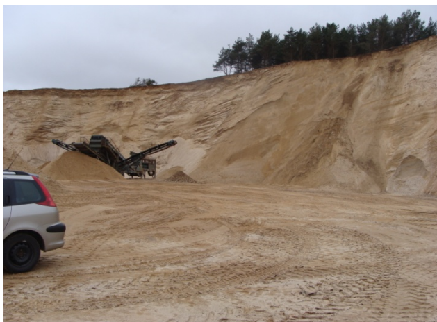
Grønbjerg grusgrav med smeltevandssand og overlejrende morænesand

I Råstofplan 2012 vil der i bemærkningsfeltet stå: "Af hensyn til et geologisk indblik ind i en bakkeø, vil det være formålstjenligt, at bevare et ikke-efterbehandlet profil i råstofgraven."