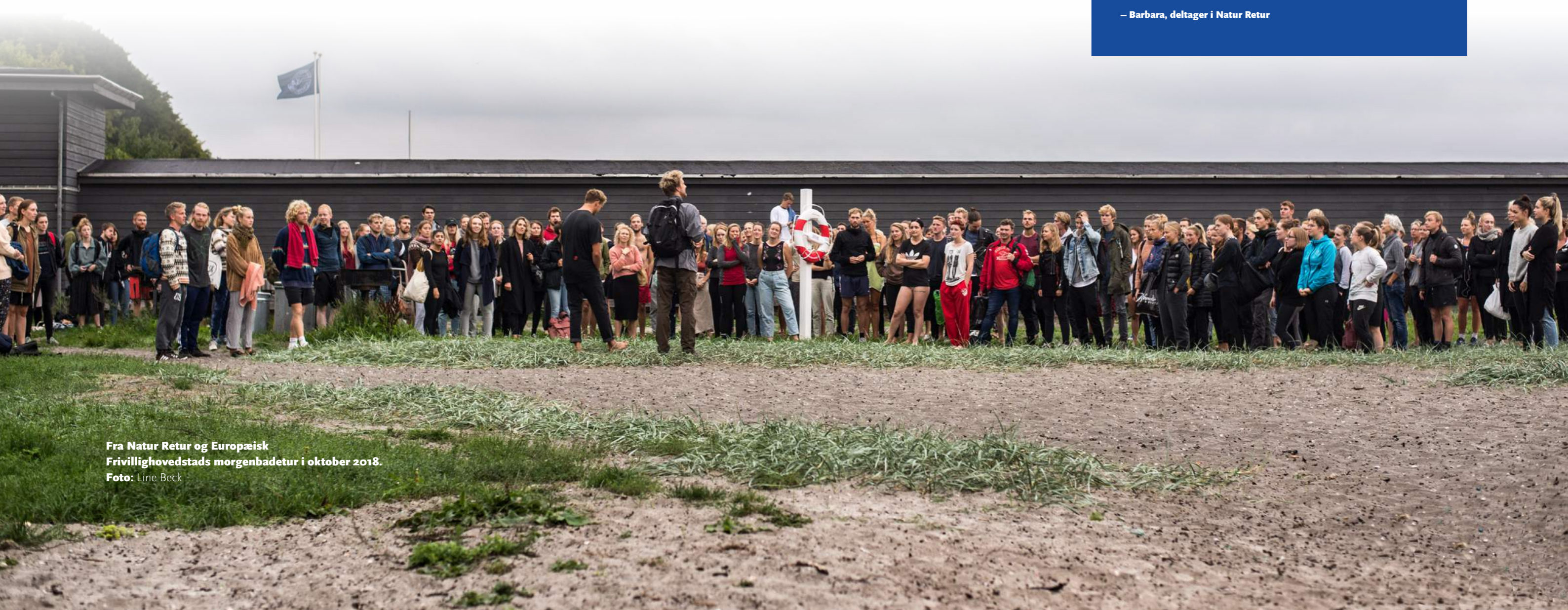
Fra Natur Retur og Europæisk Frivillighovedstads morgenbadetur i oktober 2018.