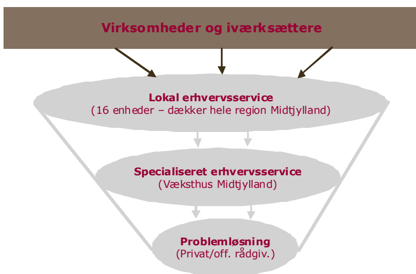
Figur: Illustration af strukturen som "tragten"

Strukturen understøtter Vækstforums udvikling og etablering af en sammenhængende programstruktur i forhold til iværksættere og virksomheder med vækstambitioner. Programmerne, som er målrettet såvel individuelle som kollektive forløb, og som Væksthus Midtjylland er operatør på, er følgende: