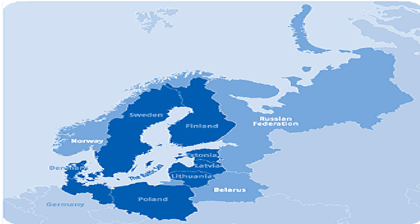
Baltic Sea Region Programme area 2007 – 2013